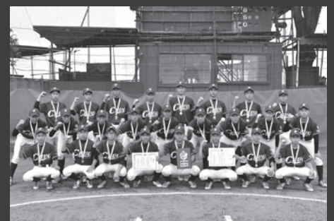
東京都西支部 三年生送別大会 優勝(2020年10月)