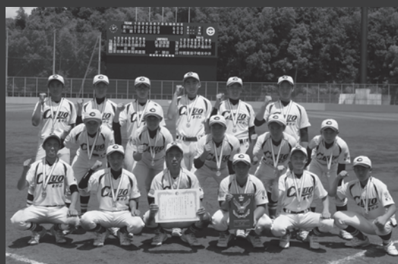
セット杯 第18回 日本少年野球 西東京大会 優勝(2019年8月)